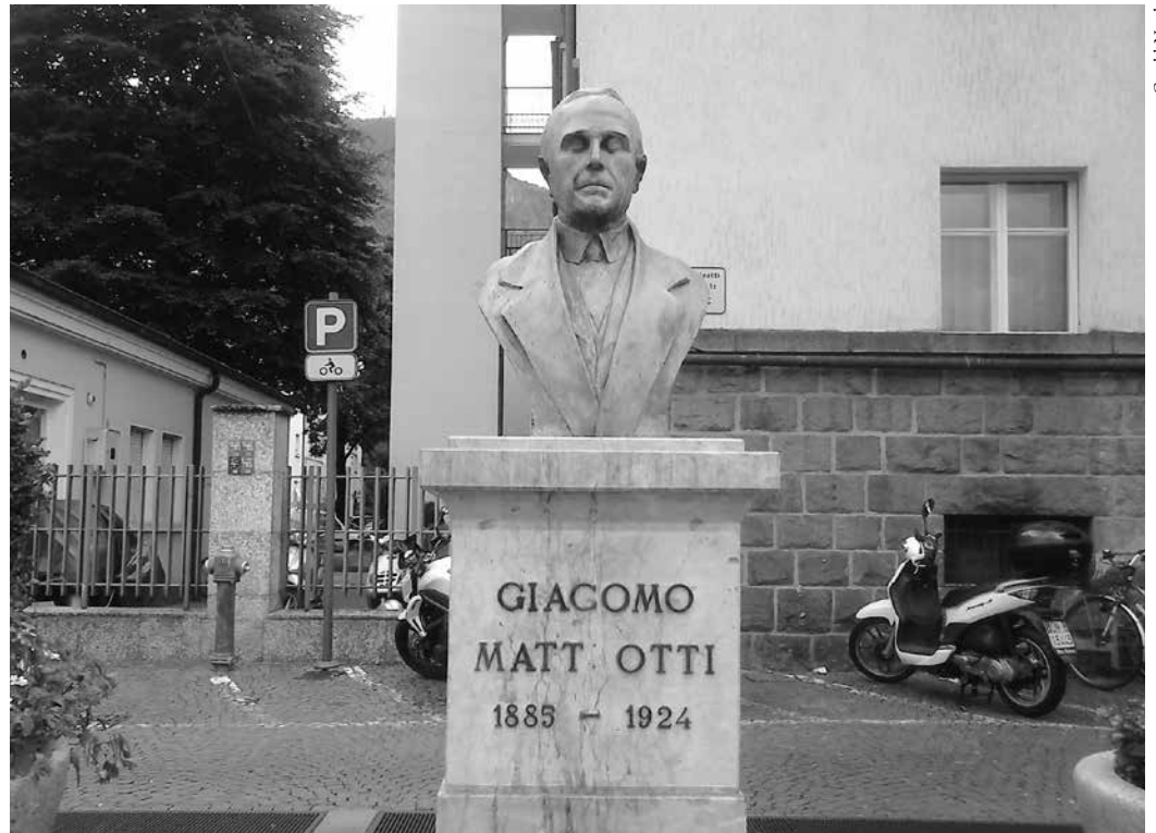
Der von den Faschisten ermordete Giacomo Matteotti hätte keine Freude, wüsste er, wer Italien regiert.

Die Geschlossenheit des rechten Lagers ist ein Grund für den Erfolg von Giorgia Meloni und ihrer Regierung. Diese ist seit 2022 im Amt und für italienische Verhältnisse überaus stabil. Doch nun scheint die Opposition ein Mittel gegen