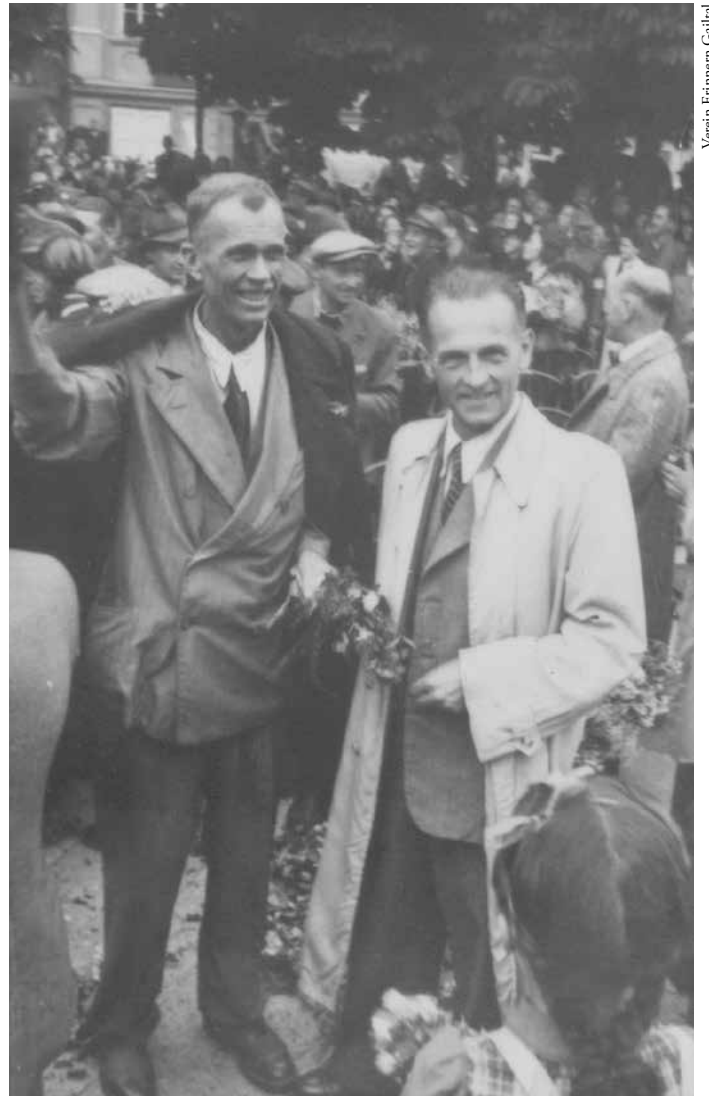
Verein Erinnern Gailtal