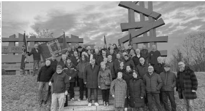
SPÖ Wiener Neustadt

„Wir wehren den Anfängen, wir werden niemals vergessen und wir sind auch bereit für die Zukunft.“ Unter diesem Motto gedachten