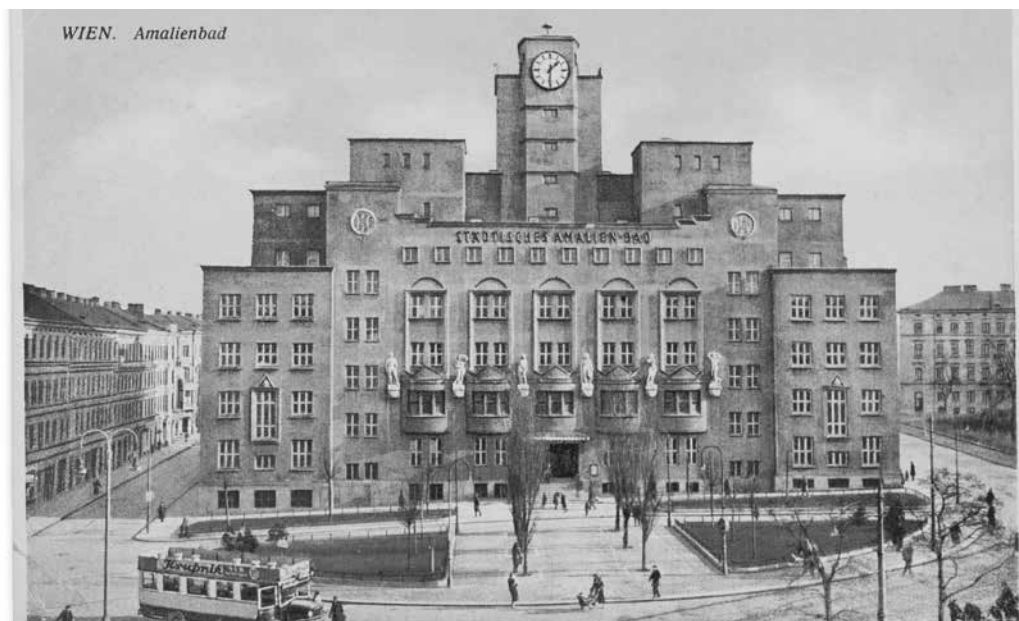
Das Amalienbad am Reumannplatz 23 in Favoriten.

Die Schwimmhalle, die auch für Sportveranstaltungen konzipiert ist und deren Dach innerhalb von drei Minuten elektrisch geöffnet werden kann, wird durch Wohlfahrtsstadtrat Julius Tandler eröffnet - vom Fünfmeterbrett aus. Der stets zu Scherzen aufgelegte Tandler meint in seiner Ansprache, dass er als Vertreter der