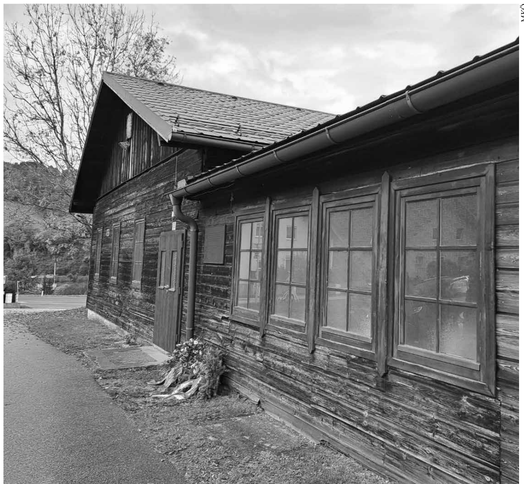
Die ehemalige Küchenbaracke in Ternberg (Bezirk Steyr-Land, OÖ).

Im Oktober 2025 startete erneut eine umfassende Ausbildung für Mauthausen-Außenlager-Guides. Sie richtet sich an Menschen, die künftig Begleitungen an ehemaligen Außenlagerstandorten sowie deren Vor- und Nachbereitung durchführen wollen. Die Ausbildung besteht aus mehreren Modulen, die sowohl historisches Wissen als auch pädagogische Kompetenzen vermitteln.